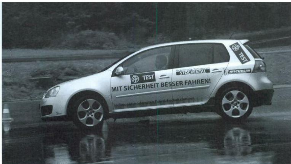
Fahrversuche mit ESP.