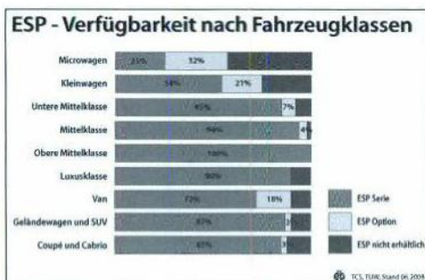
ESP-Verfügbarkeit bei Neuwagen.

Um auf diesen Umstand aufmerksam zu machen, lud der TCS mit Unterstützung der europäischen Kampagne „Choose ESC“ Verkehrsexperten, Fahrerlehrer, Fahrzeugflottenbesitzer und Interessierte zum ersten ESP-Event ins Fahrsicherheitszentrum Niederstocken BE ein. Dabei wurde von seiten des Verkehrsclubs deutlich gemacht, dass man von dieser elektronischen Fahrhilfe überzeugt ist und sie im Interesse der Verkehrssicherheit allen Automobilisten empfiehlt.